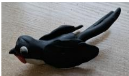
«Земля - наш дом».