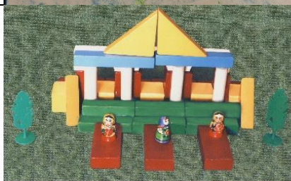
«Кукла – актриса».