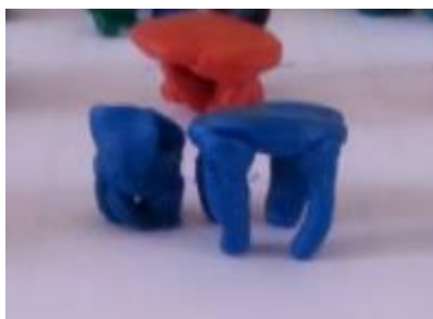
«Стол и стул»